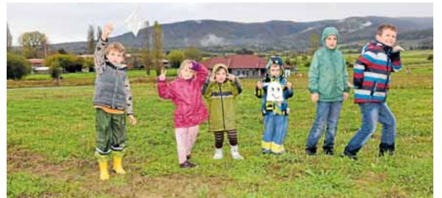
Mit der richtigen Matschaurüstung ging's auch ohne Drachen.