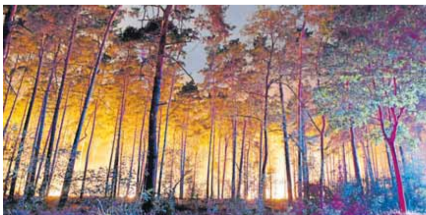
Hell erleuchtet war ein brennender Wald nahe Klausdorf in Brandenburg.

Eine Sprecherin des Landkreises Potsdam-Mittelmark sagte, sie rechne mit tagelangen Löscharbeiten rund um Treuenbrietzen. Die Glut reiche 40 bis 50 Zentimeter tief in den Waldboden. Die Bewohner