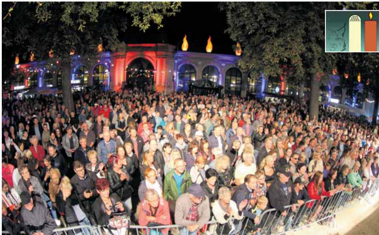
1800 Besucher feiern im Badepark die Open-Air-Summernight des Kulturklubs.