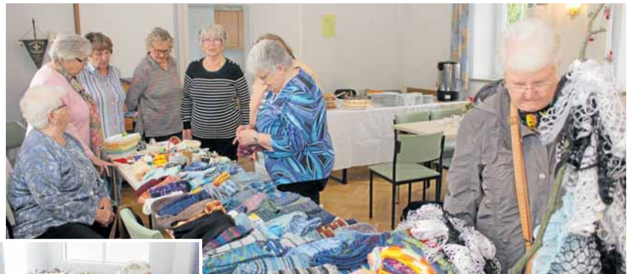
Vielerlei Socken verkauft der Handarbeitskreis Schlewecke. Aber auch Weihnachtliches ist im Angebot (kleines Bild).

Nicht nur die Fußbekleidung stellen die Handarbeitsdamen her. Aber die läuft nun mal am besten. Handbestickte Decken werden zwar alljährlich mit ausgestellt, doch der Trend geht weg von der Tischwä-